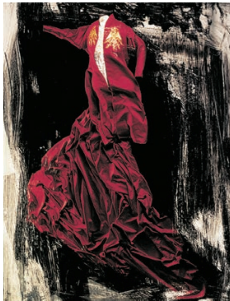
石岡瑛子 映画『ドラキュラ』(フランス・F・ Coppola監督、1992年) 衣装デザイン

アートディレクター、デザイナーとして世界を舞台に活躍した石岡瑛子。初めての大規模な回顧展が開催中だ。多岐にわたる仕事の根底に流れるものとは。