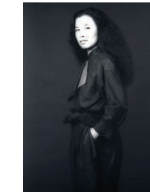
石岡瑛子 1983年