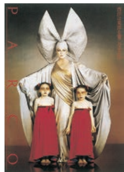
石岡瑛子 ポスター「西洋は東洋を驚かせるか」(バノコ、1979年) アートディレクション