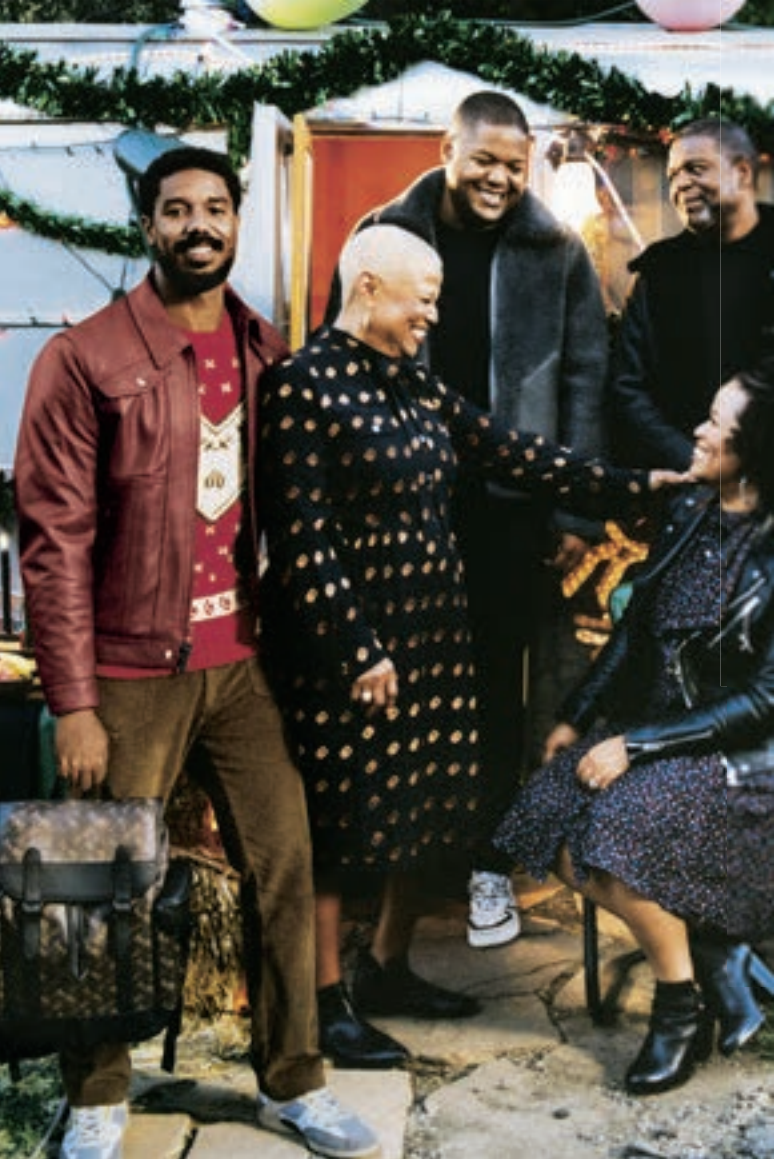
「コーチ」のメンズウェアのグローバルな顔となるのは、俳優でありプロデューサーのマイケル・B・ジョーダン(左)。ホース アンド キャリッジパターンのバックパックをクールに持つ姿が印象的