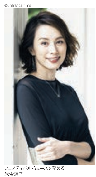
フェスティバル・ミュージズを務める米倉涼子

開催概要 「フランス映画祭2020 横浜」 期間: 12月10日(木)～13日(日) 会場: 横浜みなとみらい地区中心に開催 https://www.unifrance.jp/festival/2020/