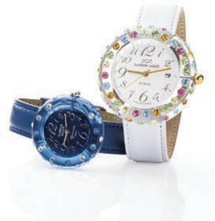
時計(左)輝きがひととき美しいVカットのスワロフスキーをベゼルにちりばめたラグジュアリーなデザイン。熟練職人が手間暇をかけて生み出す希少モデルのため、入荷するとすぐに売り切れることも。中央:“Full”¥44,000 左上:“Mini Full”¥34,000 左下・右上・右下:“Mini Full”各¥33,000 (右)エレガントでクールな“エレクトリックブルー”のウォッチは、どんな洋服にも合わせやすい1本。クリアなベゼルに選び抜かれた5色のストーンが煌めくウォッチは、ベルトの色を自分好みにカスタマイズするのもおすすめ。左:“Mini Rainbow”¥25,000 右:“Rainbow”¥28,000(すべてボンボンウォッチ / ボンボンウォッチ 銀座本店)