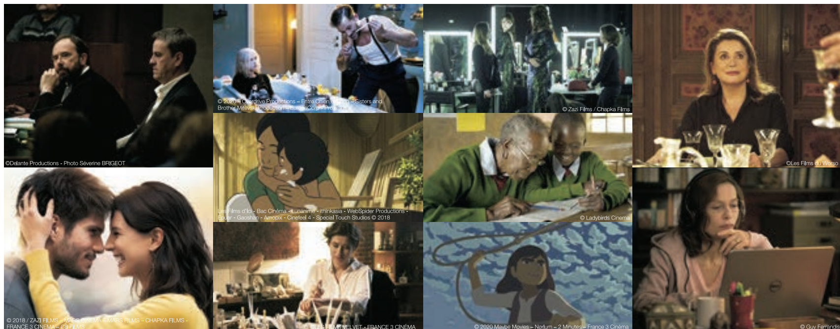
「私は確信する」「ラブ・セカンド・サイト はじまりは初恋のおわりから」「マーメイド・イン・パリ」「FUNAN ファン」「パリの調音師 しあわせの香りを探して」「MISS (原題)」「GOGO (ゴゴ) 94歳の小学生」「カラミティ(仮)」「ハッピー・バースデー 家族のいる時間」「ゴッドマザー」の10作品が上映される

「フランス映画祭2020 横浜」が幕を開ける。日仏をつないできた映画祭の歩み、そしてコロナ禍による延期を経て、開催を決めた主催者の思いを聞いた。