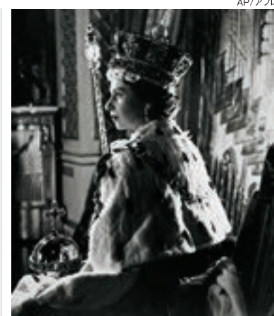
「カリナンI世」と「カリナンII世」をセットした王笏と王冠を戴冠式で着用したエリザベスII世女王陛下

Information 「Zoom」を使用したオンライン接客サービスをスタート。自宅でもどこでも販売員にジュエリー選びの相談ができ、後日来店時のお買い物がスムーズに。 www.royalasscher-jp.com/shop/reservation/4