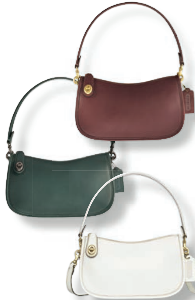
ミニマルなフォルムの“スウィンガー”は、使い込むほどにしなやかさや風合いが増すグラブタン・レザー仕立て。引き手を固定するターンロックをさりげなく主張させて。バッグ“スウィンガー” [W24×H14×D7] 各¥40,000 (すべてコーチ/コーチ・カスタマーサービス・ジャパン)