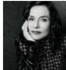
フランス代表に就任したイザベル・ユペール