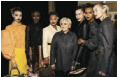
2020年2月のミラノコレクションにも一部アイテムが登場。クリエイティブディレクター、シルヴィア・フェンディ(中)とモデルたち

2020-21年秋冬ウィメンズコレクションのランウェイで注目を集めたパウダーピンク