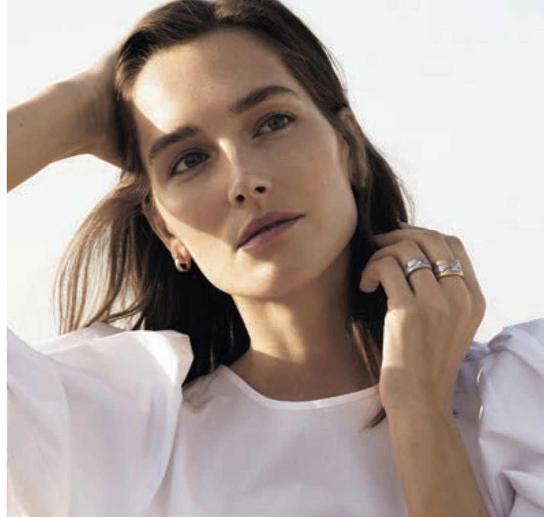
パーツを自由に組み合わせられる「フュージョン」のリング。唯一無二の個性を主張しつつ、北欧デザインらしい機能美が魅力

獅子座 7月23日→8月22日★変わる時々、今まで関心がなかったものに興味を通き、チャレンジしたくなります。この感覚は、失敗しても大丈夫、という自分の信頼からくるもの。不完全を認めたら完全近づけます。