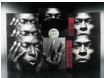
石岡瑛子 アルバムジャケット「TUTU」(マイルス・デイヴィス作、1986年) アートディレクション

代表的な仕事の一つに、マイルス・デイヴィスのアルバム『TUTU』がある。87年、ジャケットデザインでグラミー賞を受賞した。石岡は、ジャズの帝王であるマイルス