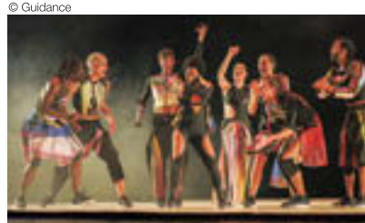
「カルカサ」マルコ・ダ・シウヴァ・フェレイラ [ロームシアター京都(サウスホール) 11月15日午後7時、11月16日午後3時] 注目の若手振付家マルコ・ダ・シウヴァ・フェレイラを含む多彩なキャストが型にはまらない陽気なコールド・バレエ(群舞)を披露。民族舞踊と現代的なアーバンダンスを融合させた複雑な足捌きが特徴。