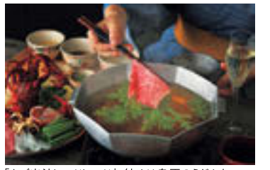
「あご出汁しゃぶしゃぶ」。締めは島原のうどんを

料金: 2泊3日 98,580円~(1名1室利用時1名あたり、税・サービス料込み、夕朝食付き) 含まれるもの: 宿泊(客室付き露天風呂)、2日間の夕食(1泊目の夕食は特別会席)、2日間の朝食 公式サイトにて5日前までに要予約 https://hoshinosorts.com/plans/JA/0000000131/0000000043