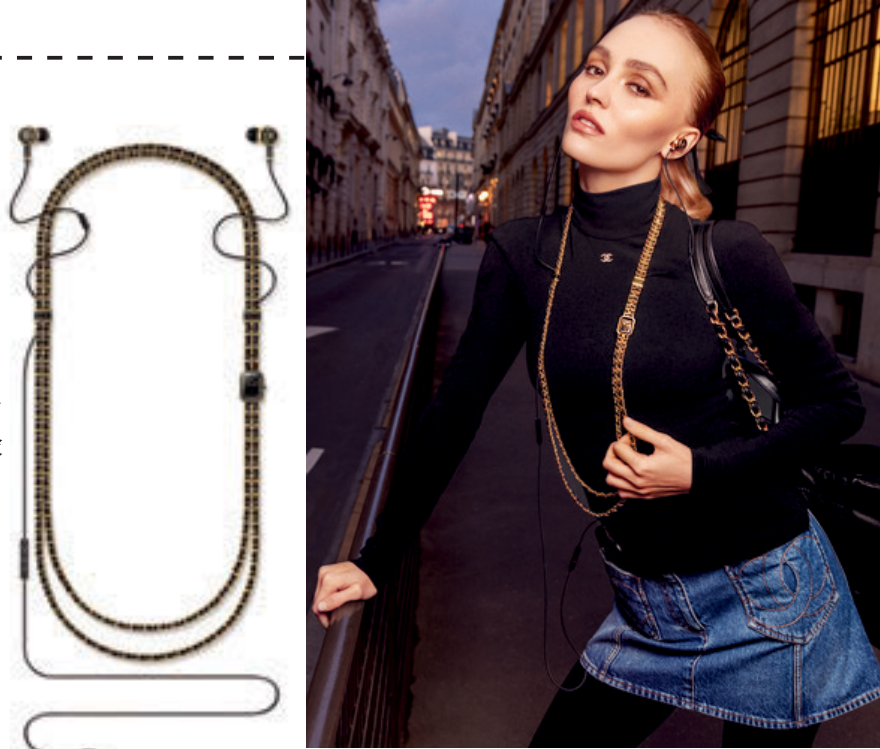
(左・中) ロングネックレスウォッチ「ブルミエール サウンド」[YGコーティングのSSケース×ブラックラッカーダイヤル、YGコーティングのSSネックレスチェーンにブラックレザーとマットブラックケーブルの編み込み、ケースサイズ 26.1×20×7.65 mm、クォーツ、マイク内蔵のイヤホン、リモコン付き] ¥2,530,000 [9/2発売] (シャネル/シャネル カスタマーケア) (右) キャンペーンにはメジンのアンバサダー、リリー＝ローズ・デップを起用。エレガンスと技術性能を融合させ、時代を捉えたクリエイティブなロングネックレスウォッチを楽しみ、パリの街を闊歩する彼女の姿がキービジュアルに