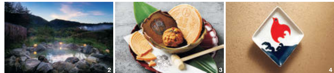
1.「客室付き露天風呂」では、開放的な湯浴みスペースから隣接する地獄の湯けむりを堪能 2.大浴場の露天風呂。源泉は宿と地続きの雲仙地獄から湧き出た鉄と硫黄分を含む強酸性のにごり湯 3.豚角煮のリエトと湯せんべいの先付け。和華蘭から着想を得た彩り豊かな器や料理 4.客室の随所に長崎文化が。焼き物「波佐見焼」の装飾も