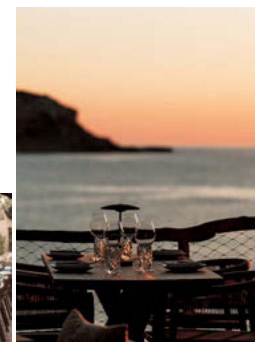
レストラン「ザ・ビーチ・ケープ」からの夕日。流れる選曲もセンスがよい

日常からいざ、非日常へ。 夏の疲れを解き放つ、 自然を感じるラグジュアリーな旅へ 出かけよう。