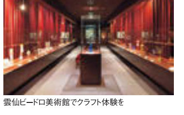
雲仙ビーロード美術館でクラフト体験を

地元の職人、生産者などのご当地体験が書籍に 全国の「界」がゲストに提供しているご当地文化体験「手業のひとつ」が一冊の書籍に。「手わざの日本旅 星野リゾート 温泉旅館「界」の楽しみ方」(のかたあきこ著・旅行読売出版社刊)で、「界」独自の滞在スタイルを知ってほしい。