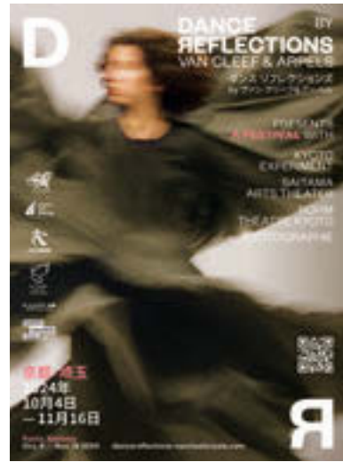
「ダンス リフレクションズ by ヴァン クリーフ&アーペル」 期間: 10月4日(金)～11月16日(土) 場所: ロームシアター京都、彩の国さいたま芸術劇場、京都芸術センター、 京都芸術劇場 春秋座 公式サイト: https://www.dancereflections-vancleefarpels.com/ja