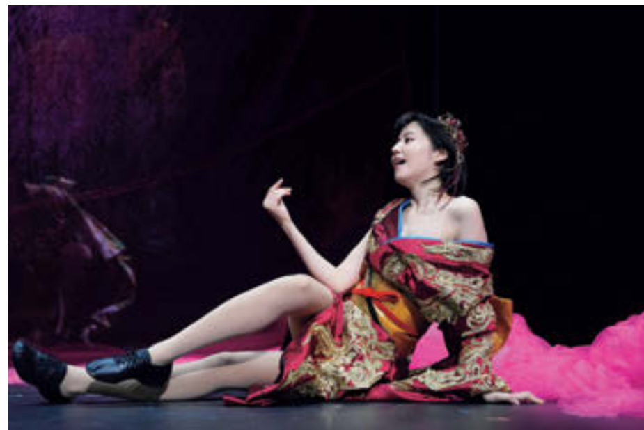
今回の舞台では、三兄弟の純粋な三男・鹿松在良と、奔放な女性・グルーシェニカという対照的な二役を演じ分ける長澤まさみ

コメディからシリアスまで多彩な役を演じ分け、数々の話題作で存在感を放つ俳優・長澤まさみ。現在は活躍の場を舞台にも広げ、さらなる進化を遂げている。そんななか出演を決めたのは、野田秀樹率いるNODA・MAPの最新作『正三角関係』。ドストエフスキーの『カラマーゾフの兄弟』を入り口にした衝撃作で、松本潤と永山瑛太とともに三兄弟に指名され、“男役”と“女役”の二役に挑む。舞台の裏側、そして今後チャレンジしたいことに迫る。