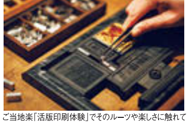
ご当地楽「活版印刷体験」でそのルーツや楽しさに触れて