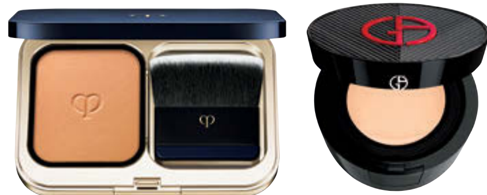
clé de peau BEAUTÉ