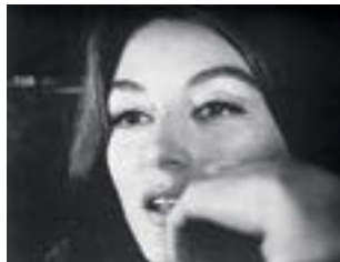
「男と女」の頃のアヌーク・エーメ