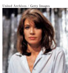
1970年代のフランソワーズ・アルディ

アヌーク・エーメを初めて銀幕で見たのは『男と女』。お互いに連れ合いを亡くし、子供をドーヴィルの寄宿舎に預けている男女の偶然の出会いから始まる大人のラブ・ストーリーです。最初にこの映画を観たのは高校生の時。それからすでにビデオ、DVDを含めて100回近く観ています。アヌーク・エーメや相手役のジャン＝ルイ・トランティニャンの何気ない、でも何か違う装いやしぐさに大いに影響を受けました。