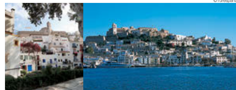
イビサ島の旧市街。自然と文化、両面で登録された世界的にも貴重な複合遺産だ

冒頭で紹介した「シックスセンス イビサ」は、世界的にもスパやウェルネス、そしてサステナビリティでも定評の