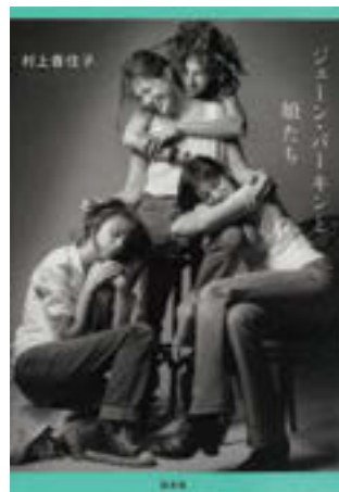
「ジェーン・バーキンと娘たち」(白水社) 著: 村上香住子