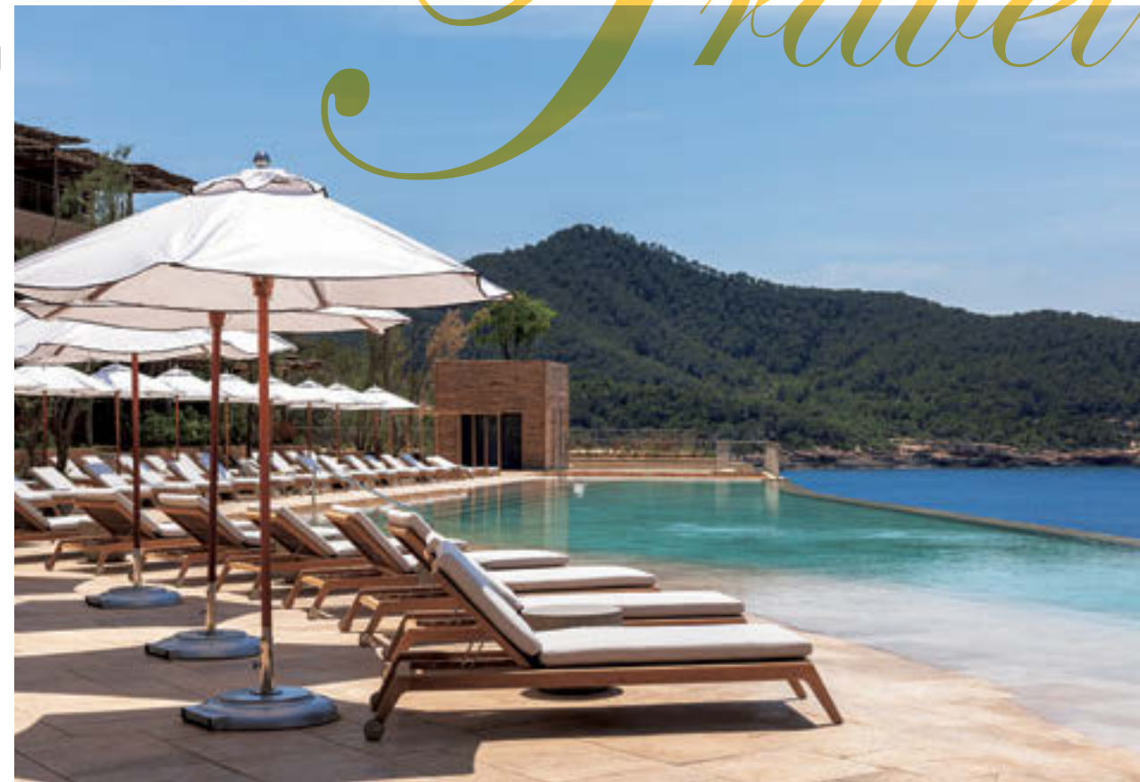
バレアレス諸島で初めて、建築分野の国際環境性能認証「BREEAM」を取得したリゾート「シックスセンス イビサ」

あるリゾートだ。ジェットバスやハمامといったスパ施設はもちろん、若返りや長寿を目指すロンジェビティ・プログラムも導入している。アクティビティではヨガやピラティスだけでなく、瞑想やサウンドヒーリングといったスピリチュアルなものも用意され、様々なアプローチで「第6感」を呼び起こす。