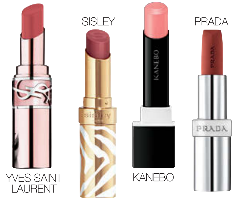
YVES SAINT LAURENT

NARS クリーミーなサテン質感。濃密で美しい色が長続き。エクスプリット リップスティック 867 ¥5,280 / NARS JAPAN DIOR メジンの縁のあるパリの景色を刻んだ特別な一本。ルージュ ディオール 720V ¥6,270 (9月6日限定発売) / バルファン・クリスチャン・ディオール Hermès ワインレッドを気負いなく、リップケースは「青」と「レザール」がキーワード。ルージュ エルメス ルージュ アレーヴル マットレッチ 73 ¥10,010 (9月1日限定発売) / エルメスジャパン CHANEL 数秘術や占星術をモチーフに。驚きのロングラスティング。ルージュ アリュール リキッド ヴェルヴェット 228 ¥5,940 (8月30日発売) / シャネル