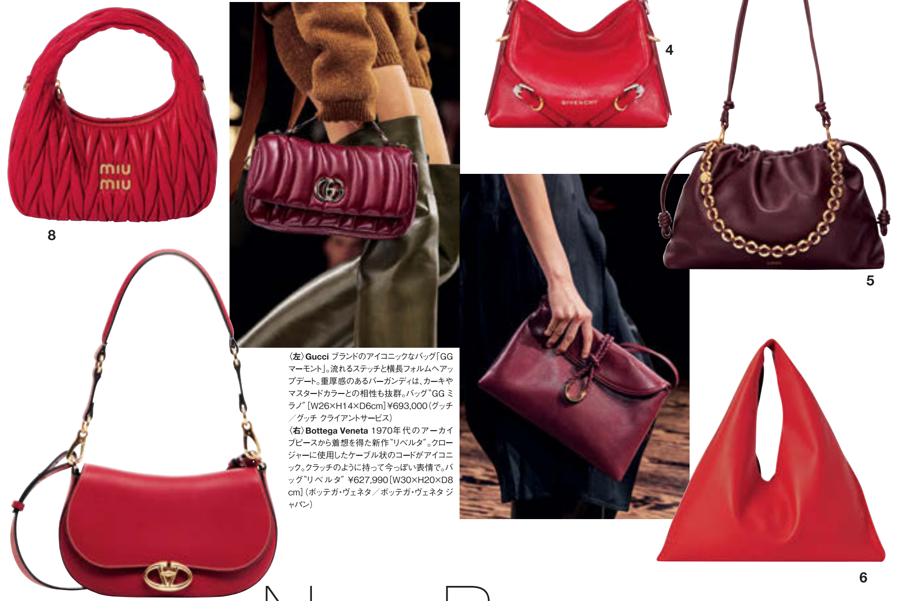
〈左〉Gucci ブランドのアイコン的なバッグ「GG マーモント」。流れるステッチと横長フォルムへアップデート。重厚感のあるバーガンディは、カーキやマスタードカラーとの相性も抜群。バッグ"GG ミラノ" [W26×H14×D6cm] ¥693,000 (グッチ/グッチ クライアントサービス) 〈右〉Bottega Veneta 1970年代のアーカイブピースから着想を得た新作"リベルタ"。クロージャーに使用したケーブル状のコードがアイコンック。クラッチのように持って今っぽい表情で。バッグ"リベルタ" ¥627,990 [W30×H20×D8cm] (ボッテガ・ヴェネタ/ボッテガ・ヴェネタ ジャパン)