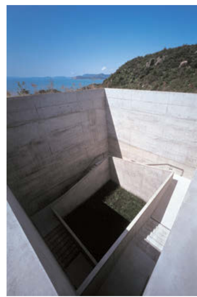
地中美術館

ベネッセアートサイト直島 住所: 直島・豊島(ともに香川県)・犬島(岡山県)に各施設が点在 開館時間・休み・問い合わせ・料金: 各施設による ホームページ: https://benesse-artsite.jp/