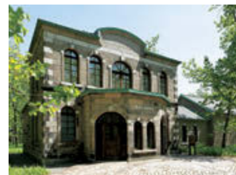
相原求一朗美術館

六花亭アートヴィレッジ 中札内美術村 住所: 北海道河西郡中札内村栄東5線 開館期間: 10月27日までの金〜日曜日、祝日の10:00〜16:00、レストランは土日祝日の11:00〜15:00 (LO14:30) 入館料: 無料 (任意による寄付制)