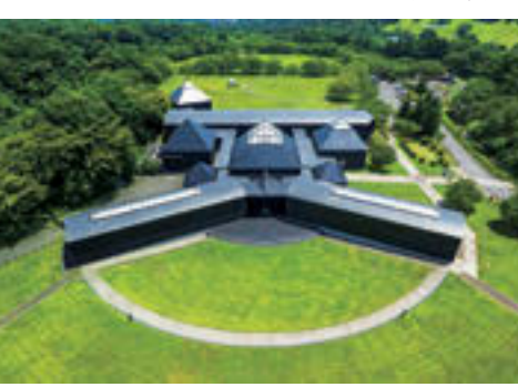
芝生に囲まれた原美術館ARC