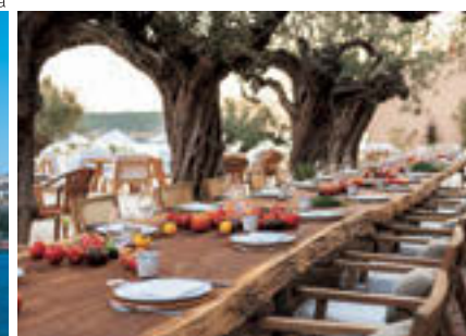
食事はオーガニック、季節感、栄養、おいしさなどにこだわる

SIX SENSES IBIZA Cami de Sa Torre, 71, 07810 Sant Joan de Labritja, Illes Balears https://www.sixsenses.com/en/resorts/ibiza/ 日本からの問い合わせ先: 0120-677-651 (インターコンチネンタルホテルズ&リゾーツ)