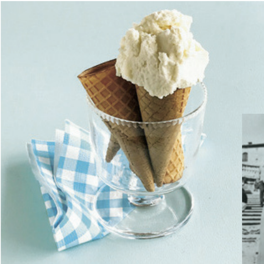
Milk GELATO flavored Roman Holiday