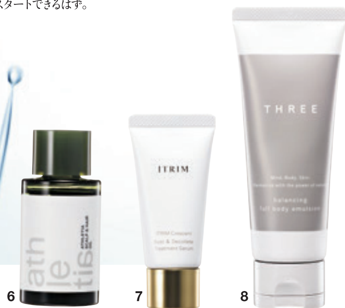
6 7 8

6.頭皮マッサージや毛先の保湿に活躍。ハーブの残り香でリラックスを。アスレティア スカルプ&ヘアオイル 50mL ¥4,000(9/18発売) / athletia 7.精油の香りで呼吸を深め、ハリに満ちた上半身へと導く。クレセント バスト&デコルテ トリートメントセラム 30g ¥12,000(9/2発売) / ITRIM 8.豊かな潤いと森林のような香り。全身の緊張をゆるめたい。バラシニング フルボディ エマルジョン 100mL ¥4,500(10/28発売) / THREE