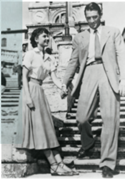
『ローマの休日』Huluで配信 © TM & Copyright 1953 Paramount Pictures Corporation. All Rights Reserved.