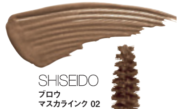
SHISEIDO ブロウ マスカラインク 02