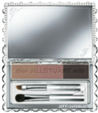
JILL STUART BEAUTY ニュアンスブロウパレット 02