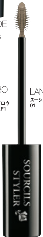
LANCÔME スーシスタイルー 01