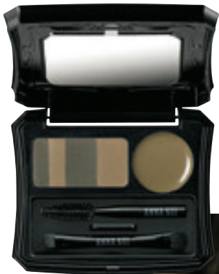
ANNA SUI アイブロウ コンパクト 03