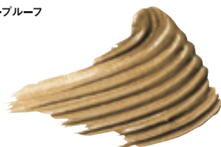
SNIDEL BEAUTY アイブロウ マスカラ 04