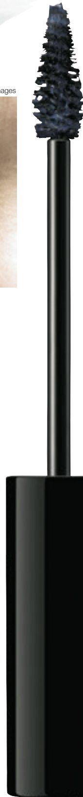
AMPLITUDE アイブロウ カラーマスカラ 05