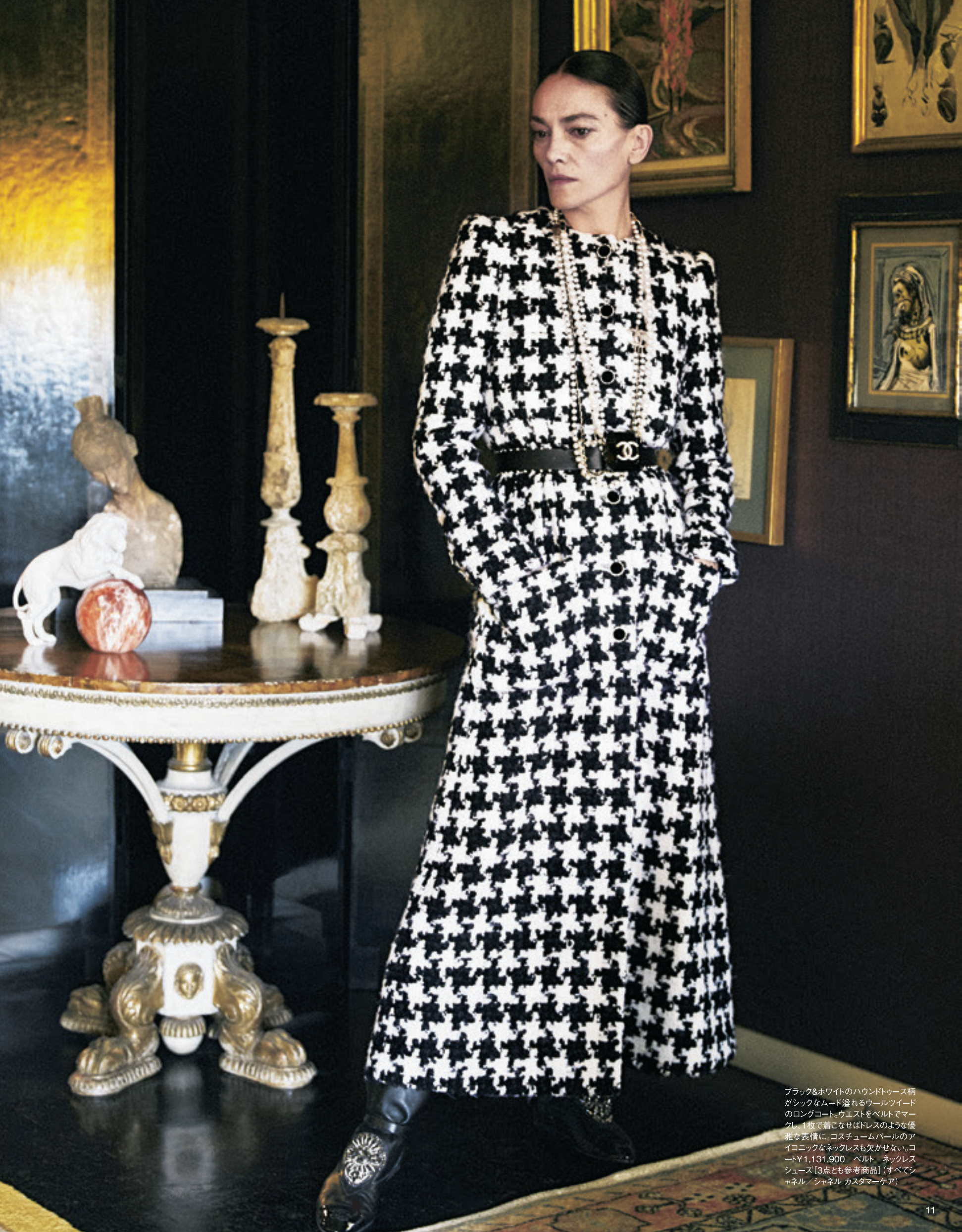
ブラック&ホワイトのハウンドトゥース柄がシックなムード溢れるウールツイードのロングコート。ウエストをベルトでマークし、1枚で着こなせばドレスのような優雅な表情に。コスチュームパールのアイコンックなネックレスも欠かせない。コート¥1,311,900 ベルト ネックレス シュース [3点とも参考商品] (すべてシャネル/シャネル カスタマーケア)