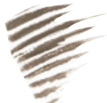
ADDICTION アイブロウ マスカラ マイクロ Cappuccino