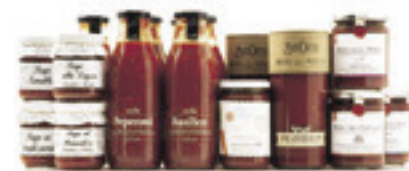
「MARKET」には厳選された16の生産者による70品目のソースとペーストが並ぶ

shop data イータリー銀座店 (EATALY GINZA) 東京都中央区銀座6-10-1 ギンザシックス 6F tel: 03-6280-6581 営業時間: MARKET: 10:00~22:30 Gran Caffè Vergnano 1882: 10:00~22:30 LA PIAZZETTA: 11:00~23:00 (L.O 22:00) LA PASTA e LA PIZZA: 11:00~23:00 (L.O 22:00) LA GRIGLIA: 11:00~23:00 (L.O 22:00) https://www.eataly.co.jp/