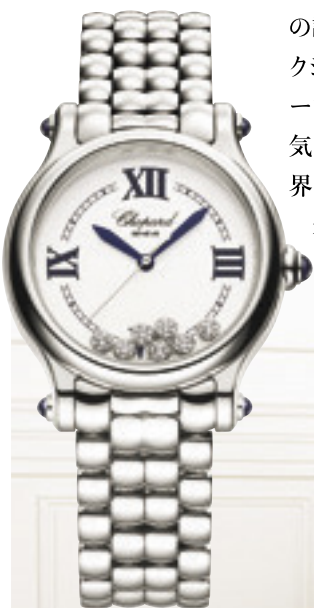
時計「ハッピースポーツ ザファースト」 [SS×ダイヤモンド、SSブレスレット、ケース径33mm、自動巻き] ¥1,254,000 [世界限定1993本] (ショパール/ショパール ジャパン プレス)

顔でいることは大好き。特に雲ひとつない青空を見上げたとき、気持ちが高まって思わず笑顔になりますね。」どんなときもハッピーオーラを漂わせる彼女だが、その秘訣は、常に前向きな心を持つこととか。「直感を信じ、「何でもやってみよう!」と好奇心を持って毎日を過ごしています。やりたいことを発見したら守りに入らず、向上心を持って挑戦するのも私のモットー。そんな活動的な自分は、今回着用した「ハッピースポーツ」ウォッチのムービングダイヤモンドのようで、共感を覚えます」