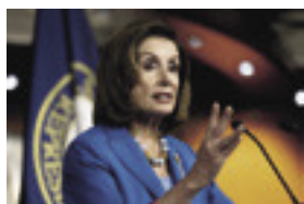
アメリカ合衆国下院議長で民主党の 重鎮ナンシー・ペロシ

※本誌に掲載されている商品の価格は 特記されている場合をのぞき、すべて税込みです。