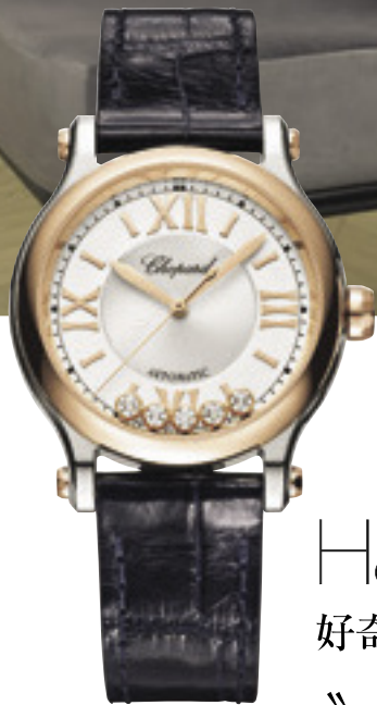
時計「ハッピースポーツ」 [SS×RG×ダイヤモンド、アリゲーターストラップ、ケース径33mm、自動巻き] ¥1,166,000 (ショパール/ショパール ジャパン プレス)