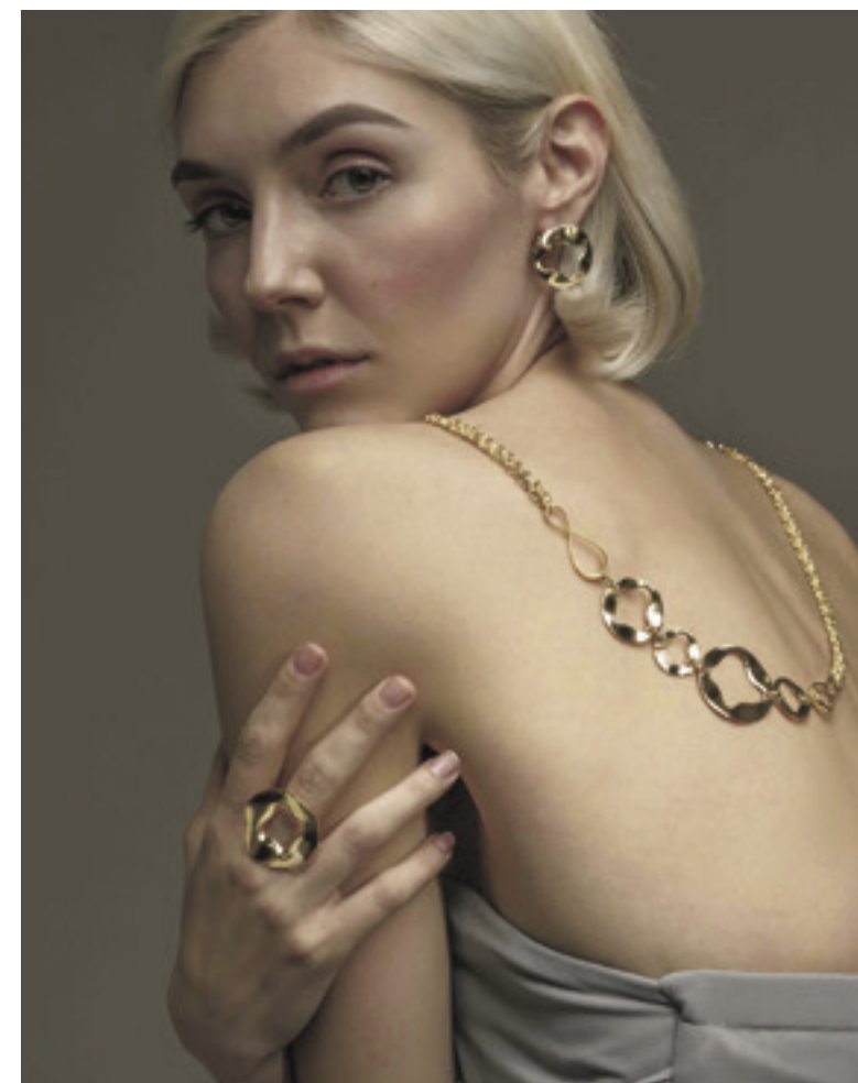
ネックレス¥4,070,000 ピアス¥1,111,000 リング¥1,199,000 [すべてYG] (すべてアントニーニ/コロネット) Photo and styling by @andrea.deotto and @numero.51 with @juliarbo