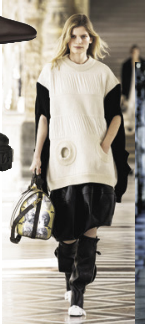
左 Louis Vuitton ニット¥443,300 [予定価格] スカート¥638,000 ブーツ[H9.5]¥300,300 (すべてルイ・ヴィトン/ルイ・ヴィトン クライアントサービス) 右 Dior アノラック¥407,000 ニット¥165,000 スカート¥396,000 ブーツ[H3.5]¥229,000 (すべてディオール/クリスチャン ディオール)