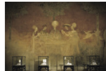
ミラノのショールームの壁面に残されている1400年頃のフレスコ画

ンとは違うからこそ、トレンドや顧客の方々の要望に真摯に向き合ってきました。そのこだわりは、すべての工程をイタリア・ミラノ周辺で制作していることに始まります。またブランドのアイデンティティが息づくミラノの芸術や建築物から着想を得たデザインを生み出してきました。100年以上の歴史があることは素晴らしいことですが、常に進化し続ける必要があります。18Kゴールドを使用し続けるという一貫性を保ちつつも、常に新たなアイデアを取り入れていきたいと思っています」