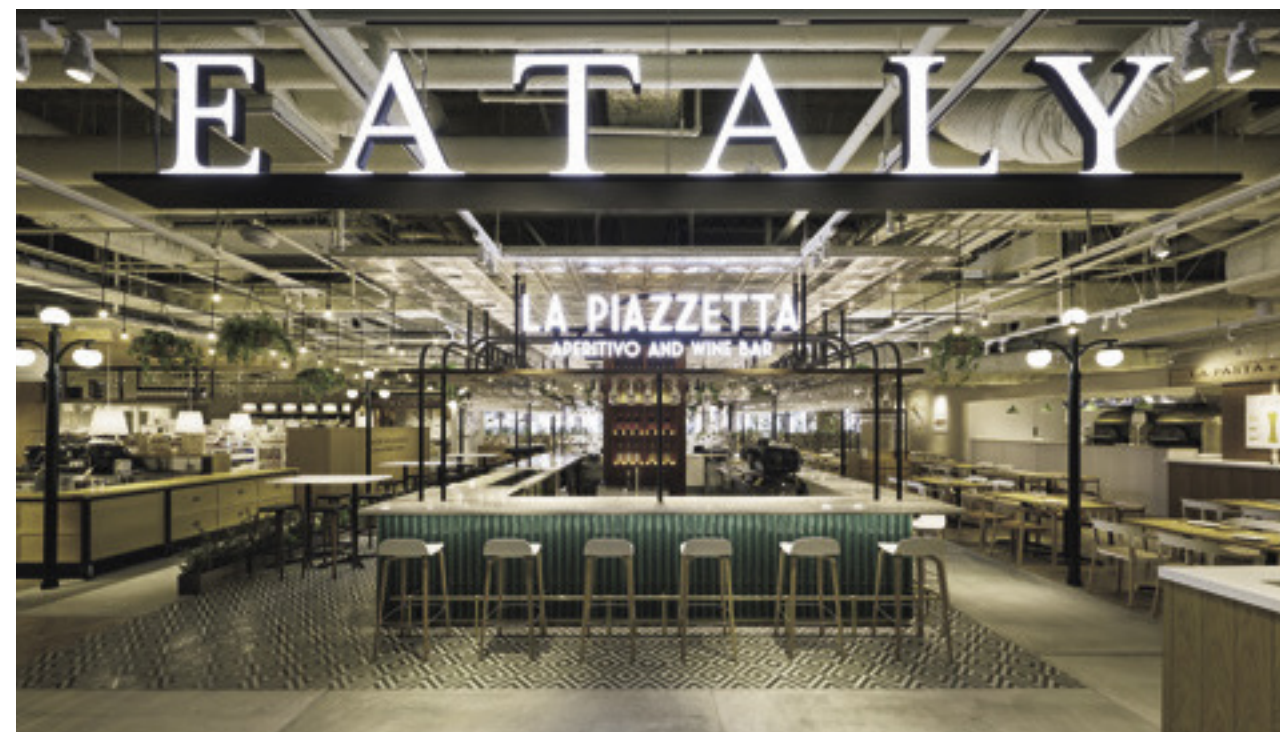
1,091平方メートルのスペースに3つのレストラン、カフェ、マーケットがある

イタリア・トリノに本店を構える食の専門店「イータリー」は、世界15カ国に40以上の店舗を展開している。店名の「EATALY」には「イタリアを食す」という意味が込められ、レストランやカフェ、マーケットなどさまざまな形で食文化を発信。「自然体でシンプルな場所」をコンセプトに、地元の生産者と提携するなど、厳選した食材をマーケットで扱い、レ