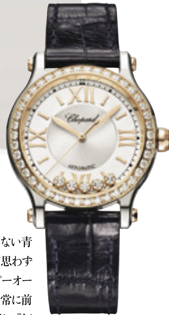
時計「ハッピースポーツ」 [SS×RG×ダイヤモンド、アリゲーターストラップ、ケース径33mm、自動巻き] ¥2,101,000 (ショパール/ショパール ジャパン プレス)