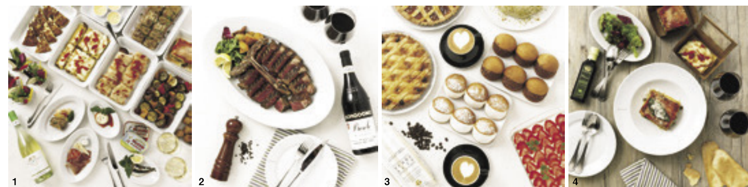
1.「陽気な街の広場」をイメージした「LA PIAZZETTA」では、小皿料理とワインをにぎやかに 2.「LA GRIGLIA」は、国内各地から取り寄せた肉、魚、季節の野菜を直火で焼き上げ、素材を生かした料理を提供する 3.「Gran Caffè Vergnano 1882」の伝統的なドルチェでカフェタイムを 4.「MARKET」では「MADE in EATALY」シリーズとしてミールキットを販売

をはじめ、約1,500種類の食材が揃う。レストランのクオリティーを手軽に自宅で再現できる「ミールキット」の販売も。実際にシェフの作ったパスタソースが真空パックされ、同梱のパスタを茹でて和えるだけで完成だ。イタリア全20州のワインを中心に、お酒は360種類以上。購入したワインをそのままレストランで味わうこともできる。レストランは小皿料理を気軽に楽しむ