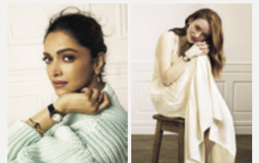
左 ディーピカー・バードウコーン 右 セイディー・シンク

クリエイティブな生き方を通して、メンが掲げる「生きる喜び」そして「自由なエスプリ」というメッセージをパワフルに発信する7人のハッピーウーマン。女優、プロデューサー、慈善家として活動し、スタイルアイコンとしても注目を集めるインド出身のディーピカー・バードウコーンや、環境保護活動にも力を注ぐスター女優セイディー・シンクなど、今をときめく顔ぶれが名を連ねている。彼女たちに共通するのは、絶え間なく動き続けるムービングダイヤモンドのように、時代の流れを感じ取り、自らの人生を大胆に切り開く自由な精神。そして万人の心にハピネスをチャージする美しいスマイルだ。多様な個性を放つ、7人のショパールフレンズに注目して。