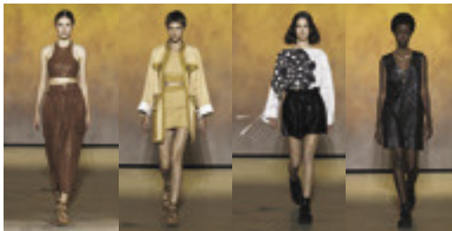
「エルメス」2022年春夏コレクションから